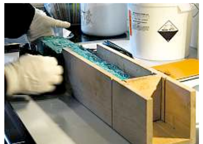
... und schneidet die Seifen. Fertig!