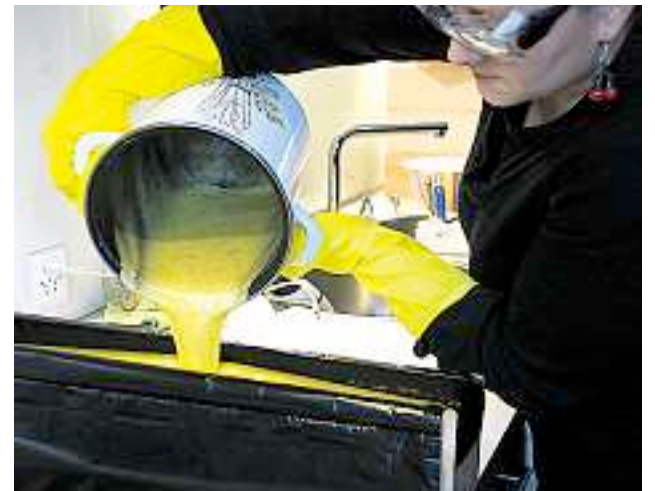
... giesst dann den Seifenleim in eine Form ...