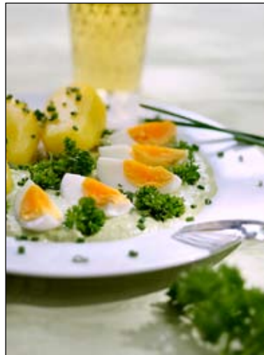
Grüne Sauce mit frischen Kräutern gilt als Frankfurter Nationalspeise und wird mit Eiern und Salzkartoffeln serviert.