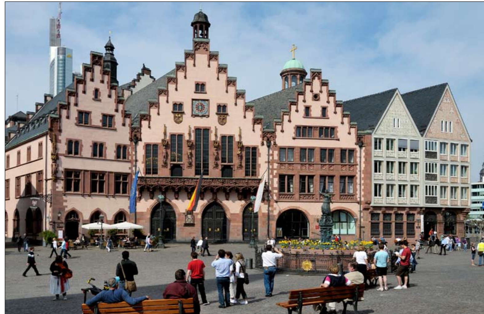
Der aus drei Häusern bestehende Römer wurde 1405 von der Stadt erworben und in ein Rathaus umfunktioniert.