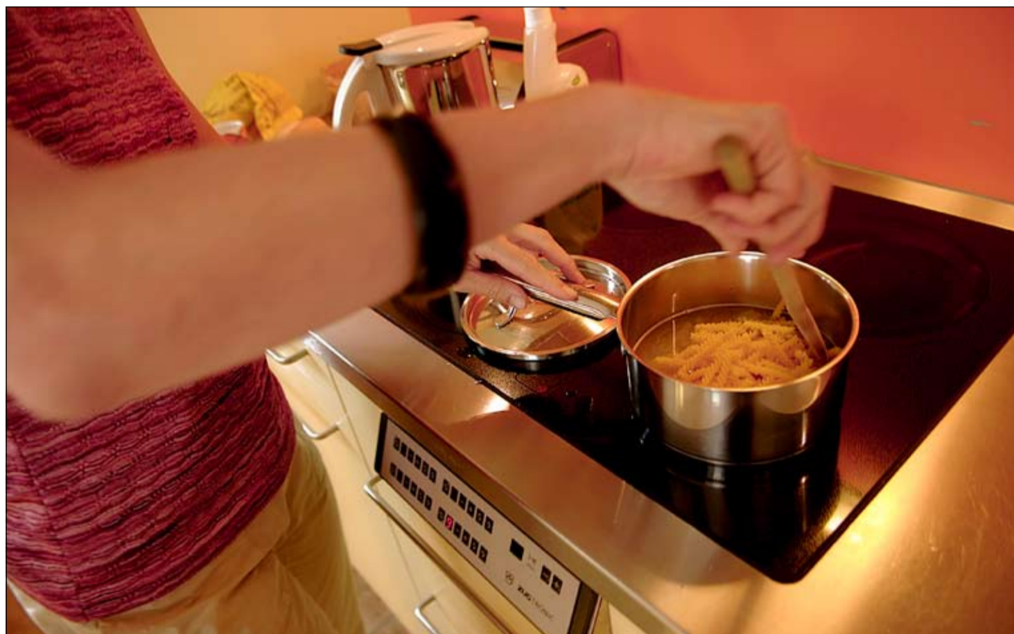
Herdplatten sollten nie unbeaufsichtigt eingeschaltet sein.